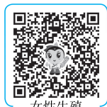
女性生殖系统疾病